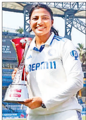
सात विकेट लेकर स्नेह बर्नी प्लेयर ऑफ द मैच

भारत की कुल 40 टेस्ट मैचों में सातवीं जीत