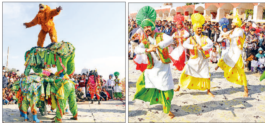
कुरुक्षेत्र। गीता महोत्सव में सांस्कृतिक प्रस्तुति देने कलाकार।

पुलिस कर्मचारी का शव मिलने की सूचना मिलते ही पुलिस की कई टीमों जांच के लिए मौके पर पहुंची थी। पुलिस ने जांच में इन्वॉल्विंग सीट पर ही एक पिस्टल भी बरामद की है वहीं कार का एयरबैग भी खून से लथपथ था। फ्लाइओवर पर दूर तक डिवाइडर पर गाड़ी टकराने के निशान भी थे, जिससे अंदाजा लगाया जा रहा है कि पुलिस कर्मचारी ने चलती गाड़ी में गोली चलाई होगी, जिससे कार हलसे का शिकार हो गई। पुलिस ने शव को पोस्टमार्टम के लिए भेज दिया है और मामले की बारीकी से जांच कर रही है।