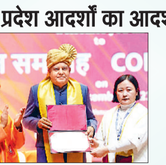
उपराष्ट्रपति जगदीप ने ग्रेटर नोएडा में गौतम बुद्ध विधि के दीक्षांत समारोह को संबोधित किया

उपराष्ट्रपति जगदीप धनखंड ने रविवार को सुदूर को 'पीडित' बताते हुए कहा कि तमाम अपमान सहने के बावजूद किसी को सेवा के रास्ते से कभी नहीं छोड़ना चाहिए। उन्होंने यह भी कहा कि किसी को भी दूसरों के दृष्टिकोण को जगह देनी चाहिए लेकिन जब दूसरों को उनके रास्ते से हटाने के इरादे से विचार प्रस्तुत किए जाते हैं तो लोगों को अपनी 'रोड़ की ताकत' दिखानी चाहिए। यहां भारतीय सांख्यिकी सेवा के प्रमुख अधिकारियों के एक समूह को संबोधित करते हुए धनखंड ने कहा कि वह उपराष्ट्रपति और राज्यसभा के समापित हैं, लेकिन लोग 'मुझे भी नहीं छोड़ते।' उन्होंने कहा, 'क्या मुझे अपनी मानसिकता बदलनी चाहिए? नहीं। क्या इससे रास्ता भटक जाना चाहिए? नहीं। उपराष्ट्रपति की दिग्दर्शी संसद के हाल में समाप्त हुए शीतकालीन सत्र के दौरान सदन में व्यवधान और राज्यसभा से विपक्षी सदस्यों के बड़े पैमाने पर निलंबन की पृष्ठभूमि में आई है।