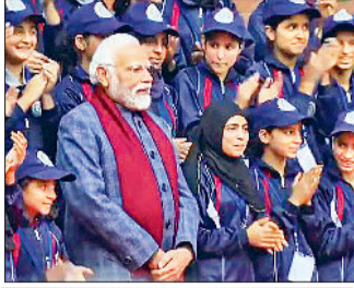
यात्रा का उद्देश्य : वतन को जानो यात्रा का उद्देश्य युवाओं को देश की सांस्कृतिक व सामाजिक विविधता से परिचित कराना है।

जम्मू-कश्मीर के लगभग सभी जिलों से वंचित पृष्ठभूमि के 250 छात्र देश का दौरा कर रहे हैं। अब उन्होंने जयपुर, अजमेर और दिल्ली का दौरा किया है। दरअसल, प्रधानमंत्री नरेंद्र मोदी द्वारा 'वतन को जानो' पहल शुरू कराई गई है। इस बीच आज रविवार को राष्ट्रीय राजधानी दिल्ली में प्रधानमंत्री नरेंद्र मोदी ने 'वतन को जानो' कार्यक्रम के तहत जम्मू-कश्मीर के 250 छात्रों से बातचीत की। बता दें कि, इससे पहले कश्मीरी युवा आदान-प्रदान कार्यक्रम वतन को जानो के अंतर्गत राजभवन में आयोजित समारोह के दौरान