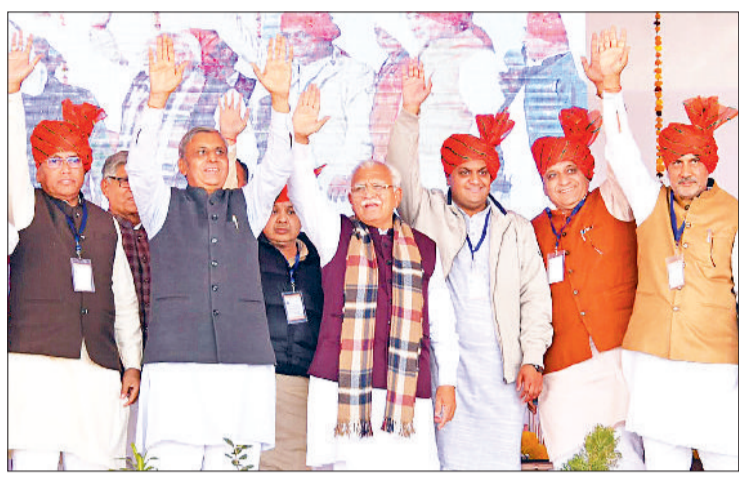
भिवानी। अन्नदाता सम्मेलन में लोगों का अभिवादन स्वीकार करते मुख्यमंत्री व अन्य नेता।

मुख्यमंत्री मनोहर लाल ने किसानों के मसीहा पूर्व प्रधानमंत्री चौधरी चरण सिंह की जयंती पर उन्हें नमन करते हुए कहा कि वर्तमान राज्य सरकार भी किसान हितेषी सरकार है और किसान व कृषि हमारी नीतियों के सदैव केंद्रीय बिंदु रहे हैं। किसानों के लिए हमारी सरकार ने निरंतर कल्याणकारी योजनाएं चलाई हैं, जिनका लाभ उन्हें मिल रहा है। हमारी सरकार किसानों के हित में निर्णय लेती है, जबकि कांग्रेस ने हमेशा किसानों को कमजोर करने का काम किया है और उन्हें